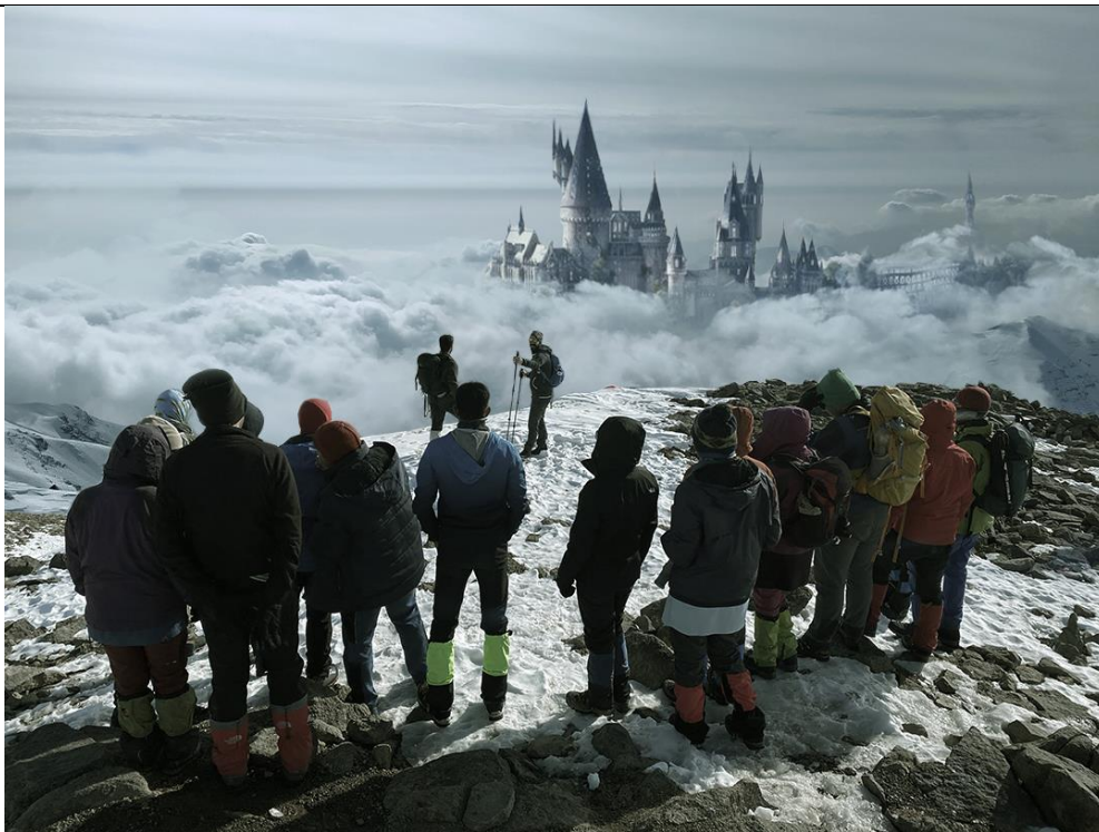
عکس های برنامه: