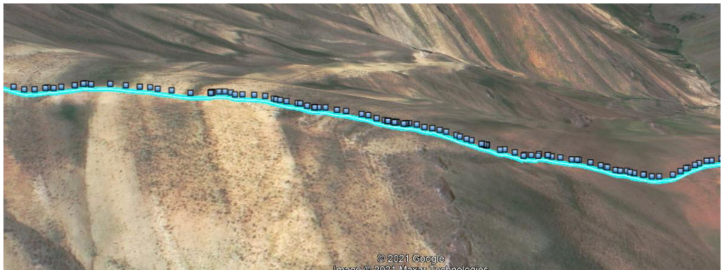
شکل 3: شیب سوم