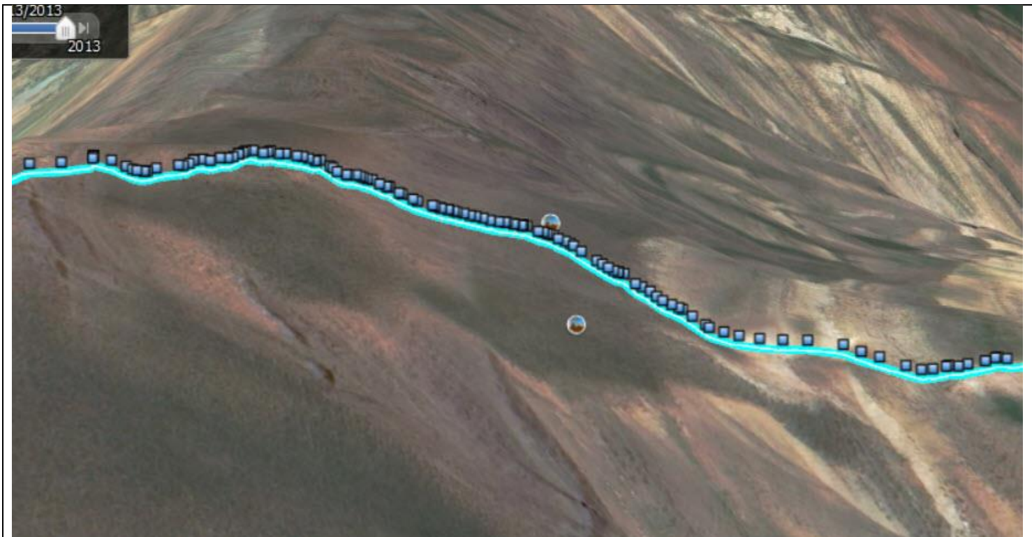
شکل 4: شیب چهارم