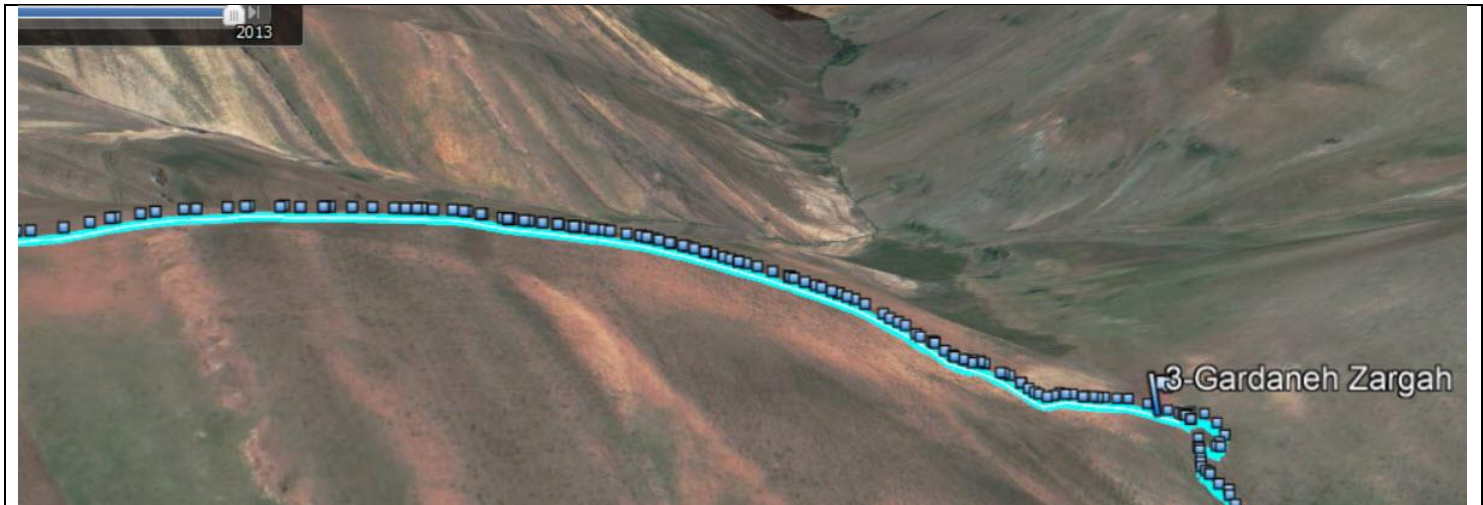
شکل ۲: شیب دوم